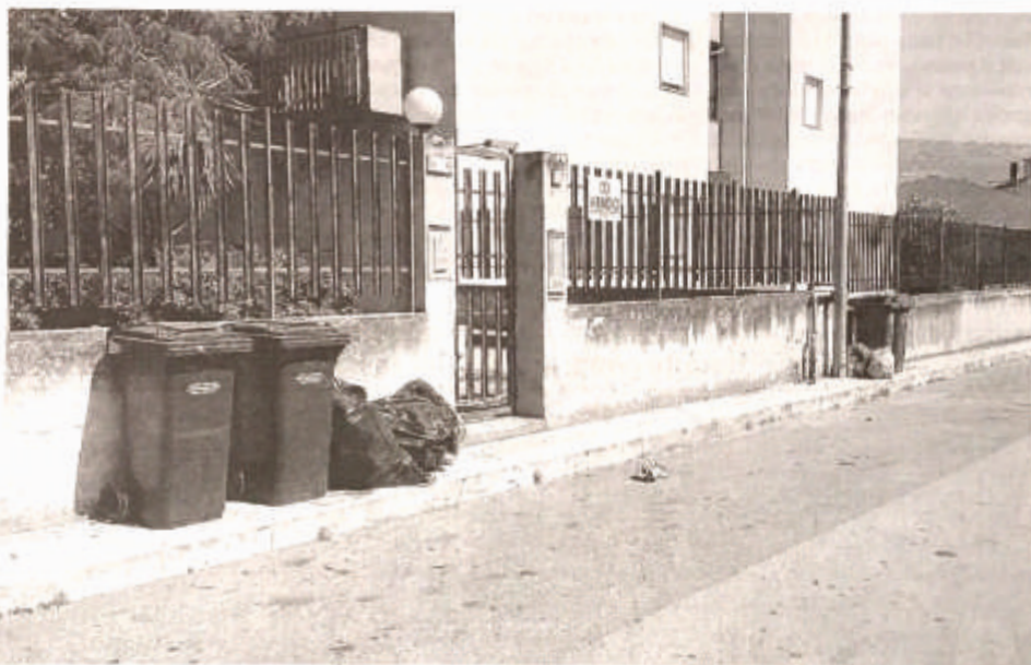
I bidoni della spazzatura in via dei Gelsi nel quartiere Santi Apostoli di Comiso