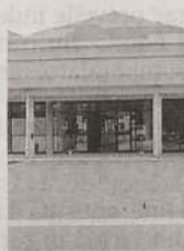
La scuola di via Giuseppe Di Vittorio

SANTA CROCE. Benefici ambientali e risparmi economici. Con il fotovoltaico si può. Parola del sindaco Franca Iurato, che registra i risultati derivanti dall'efficientamento energetico sperimentato in città. Nel giugno 2015 il Comune ha aderito al bando Cse per il finanziamento totale - da parte del ministero dello Sviluppo economico - dell'installazione di un impianto fotovoltaico della potenza di 42,5 kw nella scuola elementare "10 aule" di via Giuseppe Di Vittorio, nonché per la riqualificazione dell'impianto di illuminazione attraverso la sostituzione degli apparecchi esistenti con altri di ultima generazione a led. L'impianto di illuminazione a led ha già permesso un risparmio di energia quantificabile in circa il 30% dei consumi medi annui del