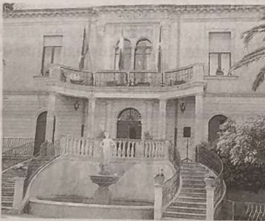
LA SEDE MUNICIPALE DI CHIARAMONTE

CHIARAMONTE. La Giunta Regionale nell'ambito del Patto per lo sviluppo della Sicilia ha finanziato ai Comuni 350 progetti per un ammontare di 250 milioni di euro relativi a interventi di riqualificazione urbana e recupero di immobili di culto. Tra tutti i Comuni che hanno ricevuto il finanziamento non risulta Chiaramonte Gulfi. I progetti finanziati ai