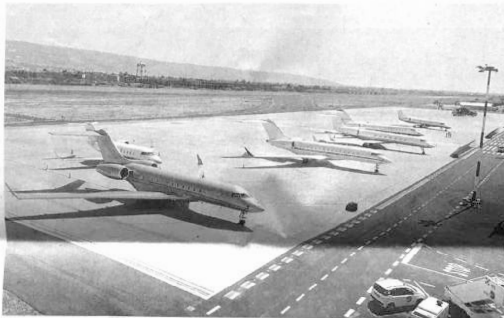
Alcuni dei charter sistemati nella zona di sosta dell'aeroporto di Comiso. I numeri sono in crescita

La stagione dei charter al Pio la Torre si è aperta ufficialmente lo scorso mese di aprile, con i voli delle compagnie "Transavia" e Hop!" che hanno trasportato a Comiso i primi turisti provenienti da Parigi, Lille e Bordeaux. I collegamenti, che resteranno in vigore per tutta l'estate, stanno portando nelle strutture ricettive della costa ragusana gruppi di turisti francesi che soggiornano per un'intera settimana nel territorio ibleo.