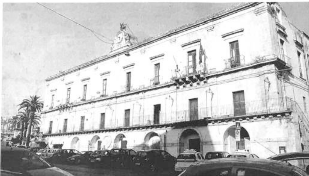
Uno scorcio di Palazzo San Domenico, sede del Comune di Modica