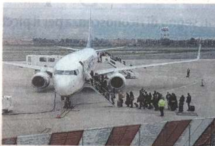
L'aeroporto di Comiso

"Per festeggiare tale evento - rimarca il deputato - l'Assemblea ha ritenuto di riconoscere all'amministratore delegato e al presidente un premio obiettivo pari, rispettivamente,