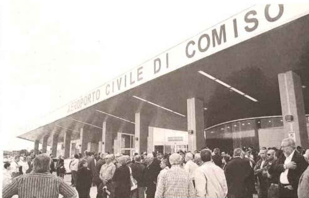
L'aeroporto di Comiso ha chiuso lo scorso anno con il «transito» di 375 mila passeggeri

*** Ai vertici di Soaco serve una figura di grosso spessore imprenditoriale, un uomo capace di fare da volano allo sviluppo dell'aeroporto di Comiso che, nonostante la crescita recente, mostra chiaramente di non per esprimere le sue potenzialità e soprattutto ha chiuso il bilancio 2015 con un forte disavanzo. È questo il pensiero del deputato regionale di Forza Italia, Giorgio Assenza, che interviene nel dibattito, finora latente, che porterà alla nomina dei nuovi vertici della società di gestione dell'aeroporto. La nomina del presidente spetta al comune di Comiso che dovrà esprimere anche il nome di un secondo membro del cda (che, nel caso in specie, coincide con la cosiddetta quota rosa e dovrebbe quindi essere una donna). Al socio privato («Intersac») spetta la nomina dell'amministratore delegato e di altri due membri del Cda. «L'assemblea dei soci del 16 giugno - scrive Assenza - ha approvato il bilancio 2015, chiuso con una perdita di 2.452.217 euro, ripianato, insieme alle perdite degli anni precedenti, attingendo al Fondo di riserva sovrapprezzo azioni che dunque si è ridotto a euro 5.821.108 dagli originari 14.997.660. L'assemblea ha anche deliberato un premio obiettivo per l'amministra-