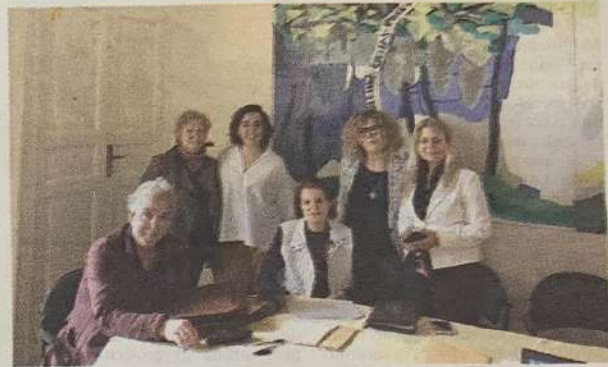
La commissione che si è riunita per valutare gli spot