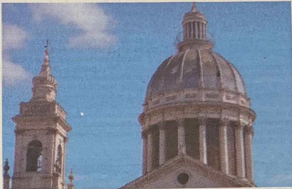
La cupola dell'Annunziata potrà essere restaurata

Da diversi anni, all'interno della chiesa, per tutto il diametro della cupola, è stata posta una rete per evitare che stucchi o intonaci, distaccandosi, possano colpire qualcuno. ●