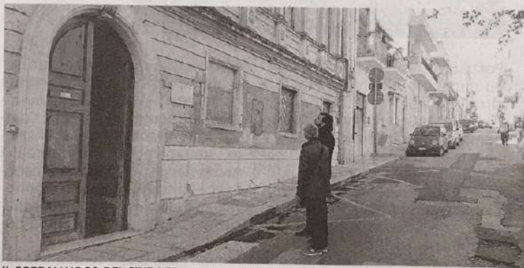
IL SOPRALLUOGO DEL SINDACO NELL'EDIFICIO CHE OSPITA LA DON MILANI

Anche la scuola Don Milani è figlia della legge sui conventi. Si deve a questa disposizione normativa, con cui il nascente regno d'Italia, attuava la sua politica di esproprio di alcuni beni ecclesiastici, se l'ex convento, monumentale complesso religioso annesso alla Chiesa di Santa Rita, abbia potuto avere una seconda e laica vita, ospitando storiche e prestigiose scuole della città. Per molti anni, nei locali dell'ex monastero sono state ospitate le sezioni ginnasiali e liceali del classico e, successivamente, sino ad oggi, quelle della scuola media "Don Milani". E ora per lo storico edificio è arrivato il tempo della ristrutturazione. Attesi da tempo i lavori di manutenzione straordinaria e, soprattutto, di adeguamento sismi-