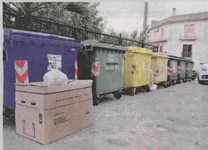
SOPRA ALCUNI CONTENITORI DELLA RD, SOTTO L'ALLESTIMENTO DELLA DITTA BUSO

Tra queste si inserisce anche quella promossa dalla ditta Busso, in programma nelle giornate di giovedì 1,