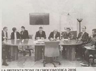
LA PRESENTAZIONE DI CHOCOMODICA 2016